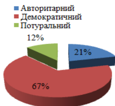
рис. 2. Стиль сімейного виховання учнів Сакаганського району 5-11 кл., 2017р.

родин учнів старших класів (67 %) панує демократичний стиль сімейного виховання. Однак, у 21 % родин учнів II-III ступенів батьки використовують авторитарний стиль виховання (див. рисунок 2).