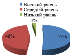
рис. 3. Готовність батьків до створення умов соціалізації особистості учнів 5-11 кл., 2017р.

Переважна більшість батьків (51 % у 5-11 класах) демонструють високий рівень готовності до створення умов соціалізації особистості дитини. Найголовнішою функцією сім'ї батьки одноставно визначили становлення особистості дитини та її виховання, найменш потрібною – формування уявлень про можливість завдяки шлюбу підвищити свій соціальний статус. Батьки учнів середньої та старшої ланки виділяють найголовнішими функціями навчитися не боятися труднощів, бути цілеспрямованим; навчитися дітям захищати себе, бути впевненим у собі. До найменш важливих було віднесено формування господарського ставлення до довкілля.